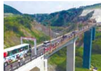
長陽大橋