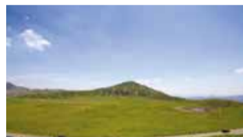
阿蘇・草千里ヶ浜