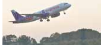
香港線(香港エクスプレス)