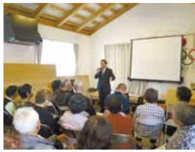
仮設団地で知事がすまいの再建支援策を説明