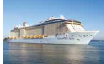
クルーズ船(クアナム・オブ・ザ・シーズ)