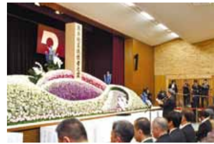
犠牲者追悼式(県庁地下大会議室)